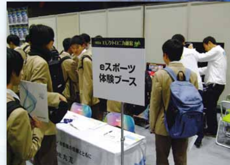
eスポーツ体験ブースも大盛況でした。

一般社団法人 新潟県電子機械工業会 担当：島田・高橋 〒940-2127 新潟県長岡市新産4丁目1-9 NICO テクノプラザ1F Tel. 0258-21-5400 Fax. 0258-21-5488 E-mail. neia@neia.or.jp URL. https://www.neia.or.jp