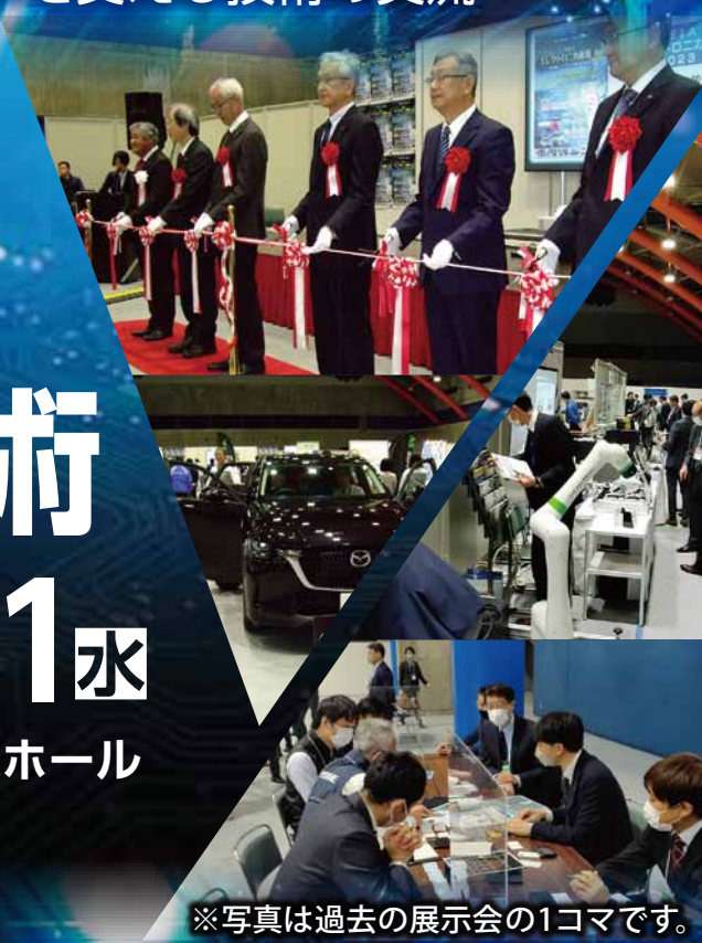
※写真は過去の展示会の1コマです。

〒940-2127 新潟県長岡市新産4丁目1-9 NICO テクノプラザ1F Tel.0258(21)5400 Fax.0258(21)5488 https://www.neia.or.jp