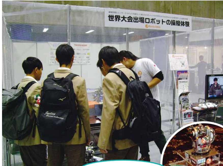
ロボットの操縦体験!

PhoenixRobots ※ のデモンストレーション、操縦体験をたくさんの来場者楽しんでいただきました。 (※長岡技術科学大学の学生さんたちを中心にしたチームで、昨年8月、世界大会 RoboMaster に出場。)