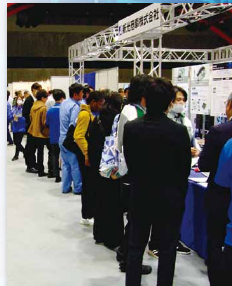
会場の一コマ(R5. 開催時)