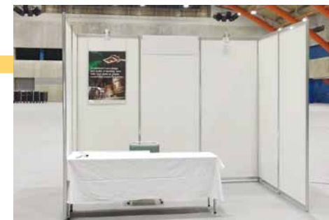
長机(W=1,800mm)、イス、背面にかかっているパネル及び スポットライト(2個)はオプション備品です。