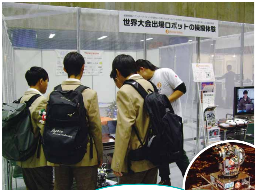
ロボットの操縦体験!

(※長岡技術科学大学の学生さんたちを中心にしたチームで、昨年8月、世界大会 RoboMaster に出場。)