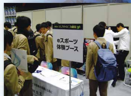
eスポーツ体験ブースも大盛況でした。

一般社団法人 新潟県電子機械工業会 担当：島田・高橋 〒940-2127 新潟県長岡市新産4丁目1-9 NICO テクノプラザ1F Tel. 0258-21-5400 Fax. 0258-21-5488 E-mail. neia@neia.or.jp URL. https://www.neia.or.jp