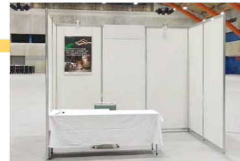
長机(W=1,800mm)、イス、背面にかかっているパネル及び スポットライト(2個)はオプション備品です。