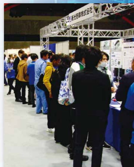
会場の一コマ(R5. 開催時)